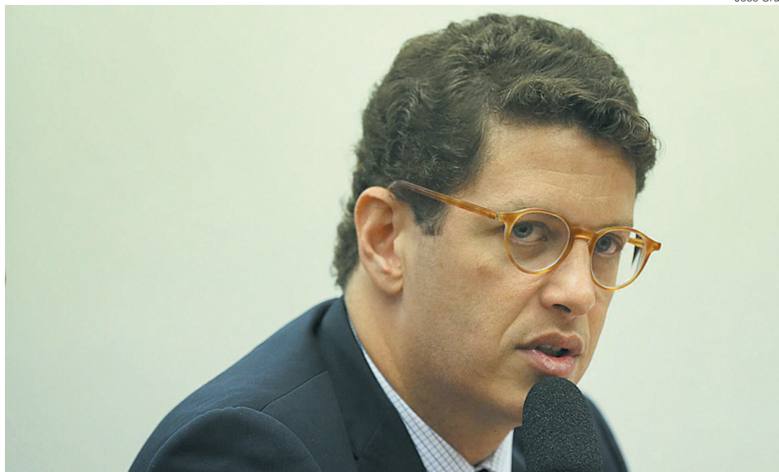
Salles é alvo de inquérito por supostamente ter atrapalhado investigações sobre apreensão de madeira; Ele nega ter cometido irregularidades

Na ocasião, segundo o parlamentar, o presidente afirmou que procuraria a Polícia Federal para investigar o caso. Apesar do aviso, o governo seguiu com o negócio em que prevê pagar pelo imunizante indiano um preço 1.000% maior do que o anunciado pela própria fabricante seis meses antes.