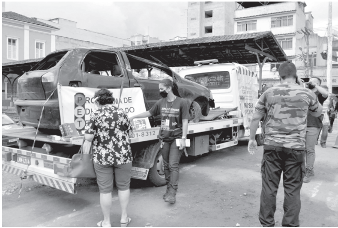
Durante a ação foram realizadas simulações de acidentes