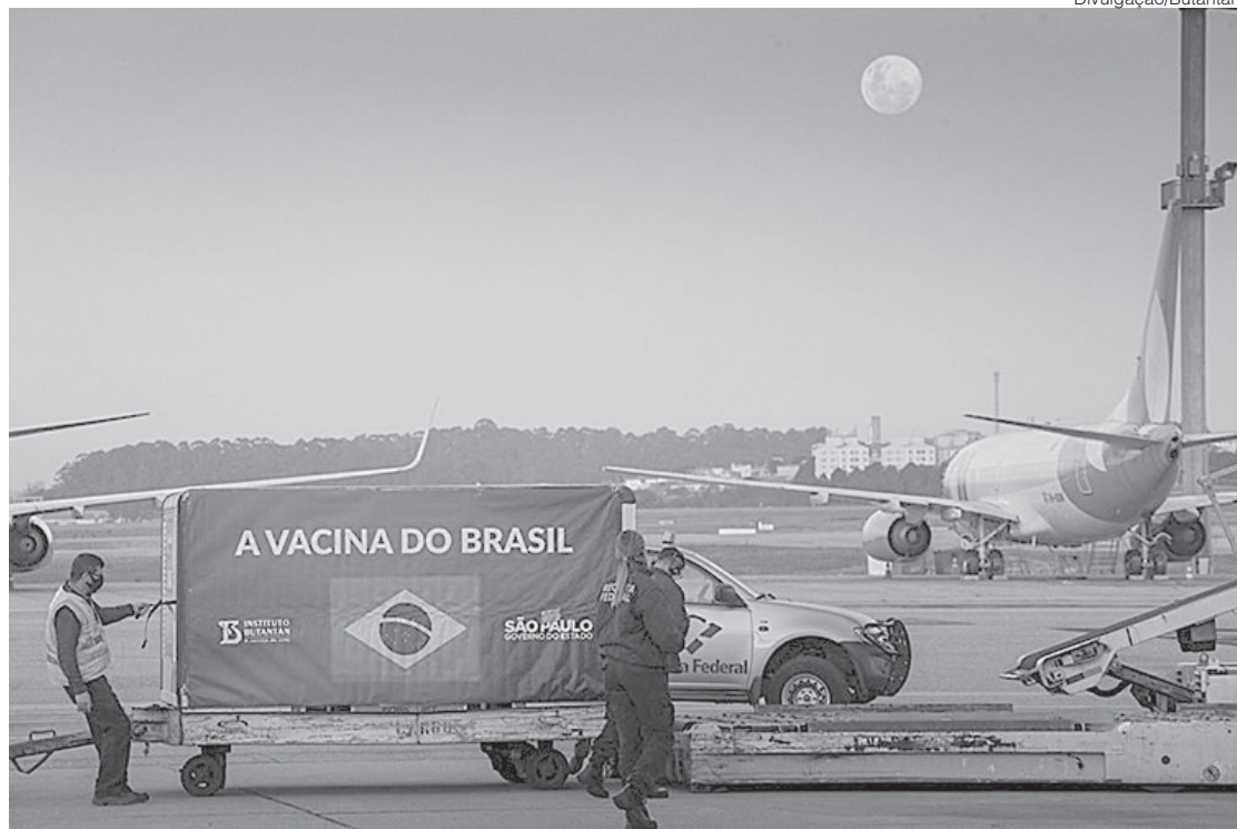
Instituto já entregou 52 milhões de doses de vacina ao governo federal