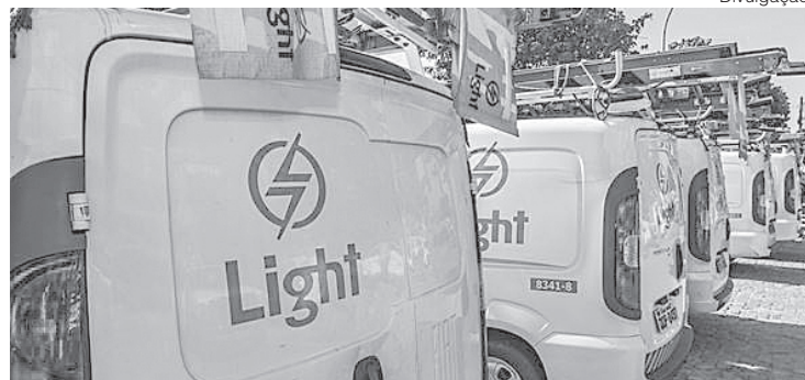
A medida visa evitar a formação de filas e aglomerações em ambientes fechados

Os clientes que precisarem de atendimento em uma das agências devem agendar previamente o serviço pelo Disque-Light Comercial (0800-282-0120), escolhendo a data, a hora e o endereço de sua preferência. No dia do atendimento, os