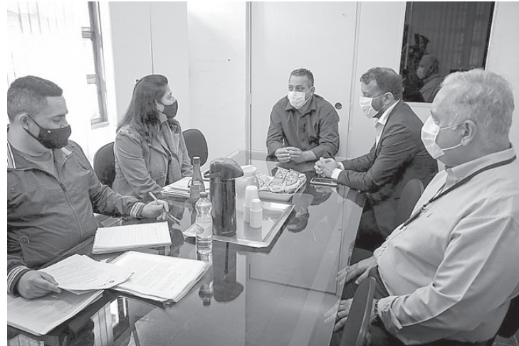
Segundo prefeitura, aulas serão no formato híbrido

– Hoje estamos discutindo o retorno das aulas, com muita segurança para os