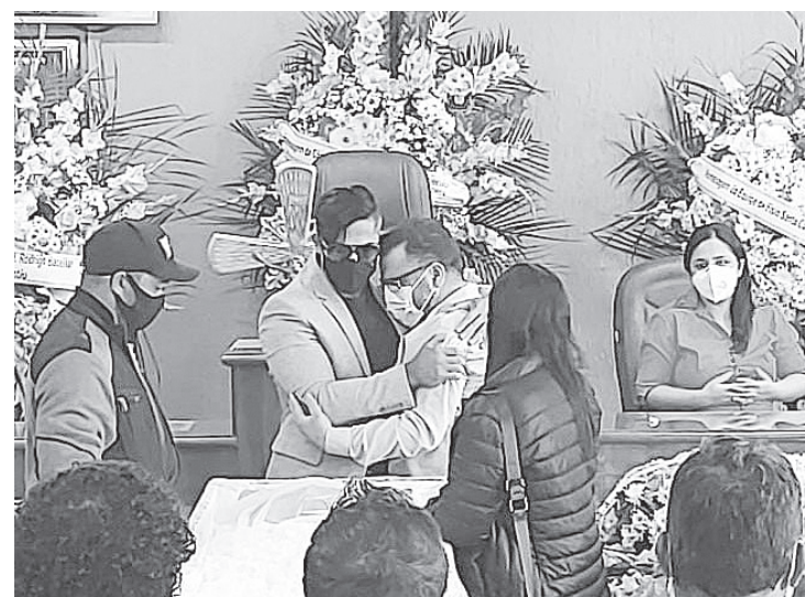
Corpo foi velado ontem no Palácio Barão do Rio Bonito, sede do Poder Legislativo