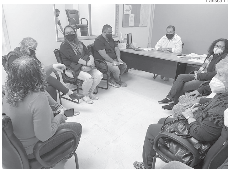
Reunião discute projetos para melhorar a qualidade de vida de pessoas com deficiência

“Foi tudo muito produtivo, uma ótima conversa com todos os presentes. Ficou combinado de acompanharmos mais de perto para que a gente possa dar