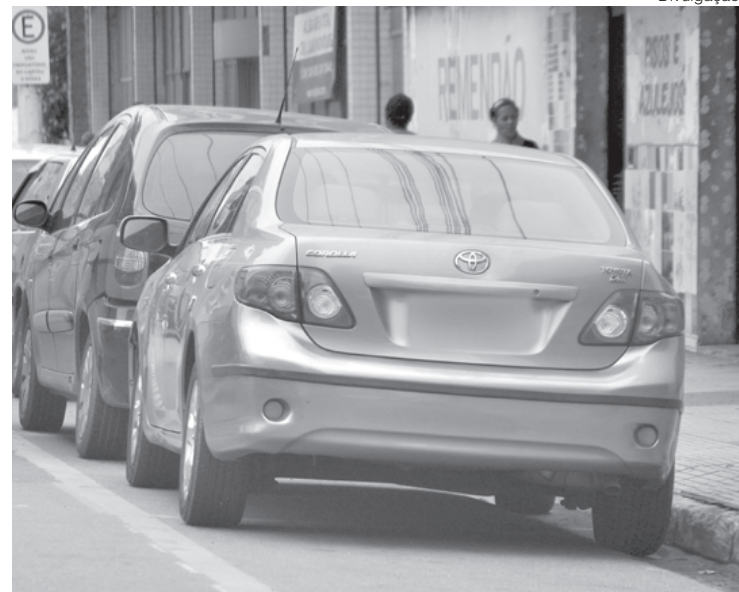
Procurou um cobrador por 10 minutos, mas ao não encontrá-lo desistiu

Em nota, a gerência do Consórcio Rotativo VR Digital informou que, após analisar a situação em questão e recolher todas as informações junto ao setor operacional, “foi identificado que no horário e local onde o veículo em questão encontrava-se sem a emissão do bilhete de estacionamento havia a presença de colaboradores do VR Parking exercendo suas funções normalmente sendo indispensável lembrar novamente que além dos monitores, é possível realizar a ativação do estacionamento pelos outros meios de pagamento disponíveis, quais sejam,