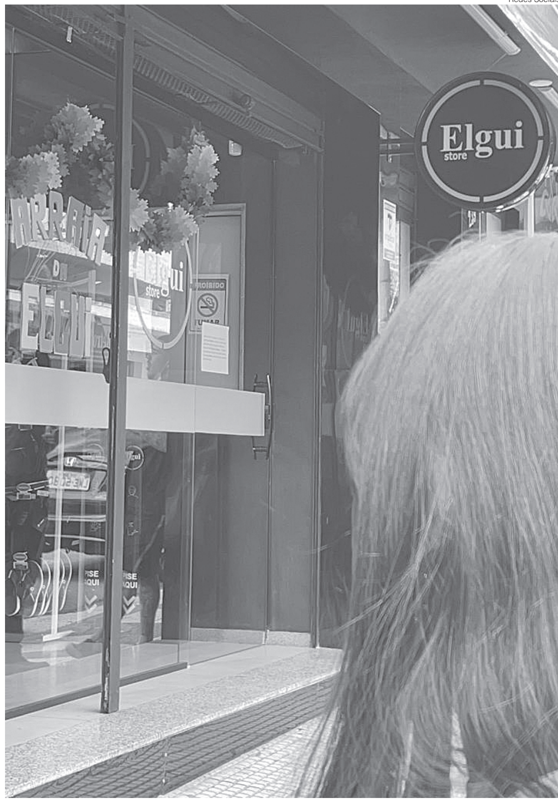
Loja alega falta de fornecedores e que a pandemia dificulta a importação dos aparelhos eletrônicos

Por fim, a loja mencionou que os canais de atendimento online estão de plantão para prestar todas as informações necessárias ao cliente. Loja Barra Mansa (99923-9260) e loja Volta Redonda (99852-0141).