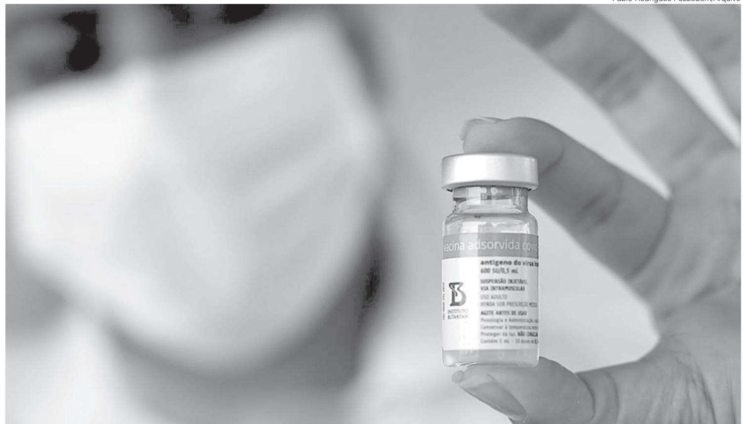
No Rio de Janeiro o índice de doses aplicadas em pessoas residentes em outras cidades ou estados é de cerca de 10%, entre a primeira e a segunda doses

A orientação é dada também pela própria Secretaria de Saúde do estado. A superintendente de Epide-