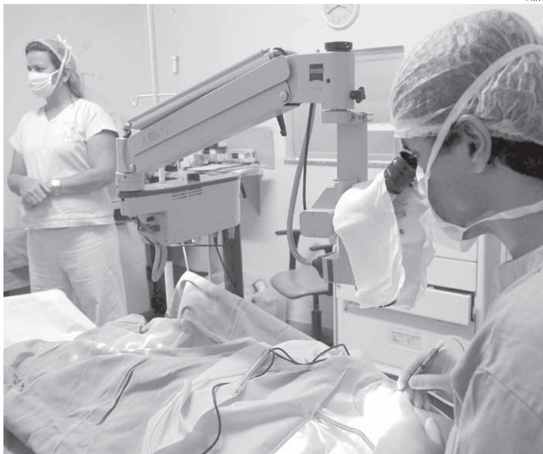
Um centro cirúrgico oftalmológico móvel ficará estacionado na Ilha São João para realizar atendimentos

Conceição citou que as cirurgias dentro da unidade móvel seguirão as medidas de prevenção à Covid-19 e as normas de higiene e segurança estabelecidas pela Vigilância em Saúde.