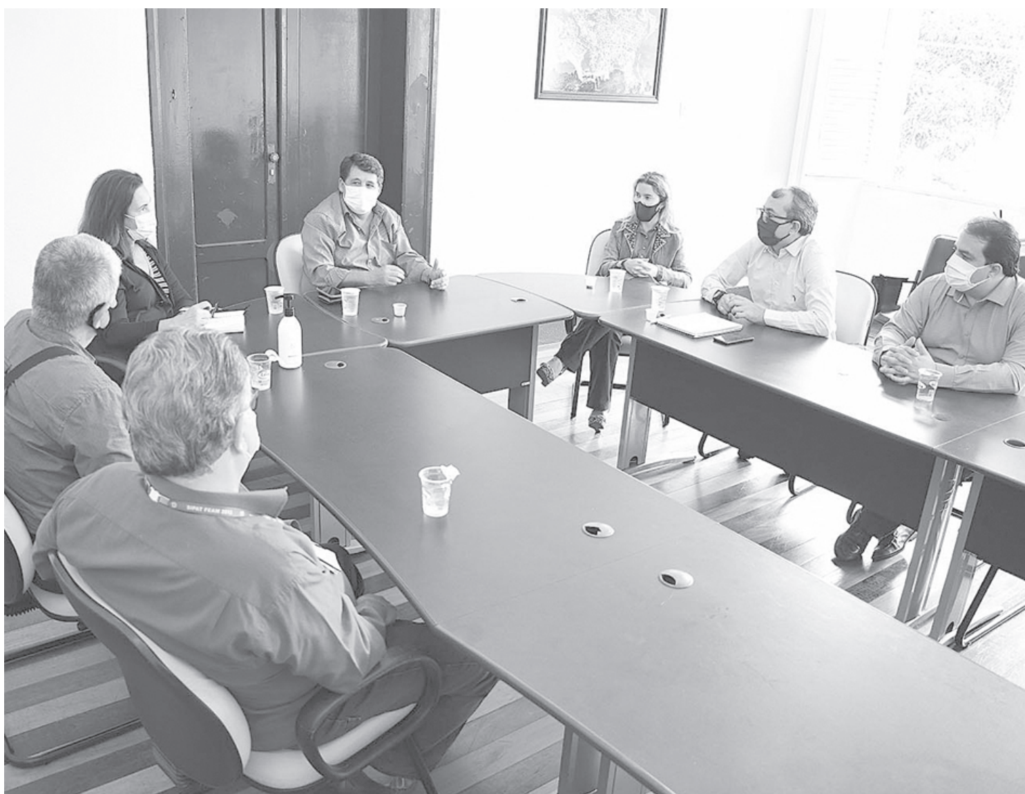
Acordo para reabrir agência do INSS foi firmado no Salão Nobre da Prefeitura de Angra

Temos total interesse nesse convênio e o nosso objetivo é que o espaço seja aproveitado para a ampliação dos serviços de saúde à população na região central – comentou o secretário de Governo.