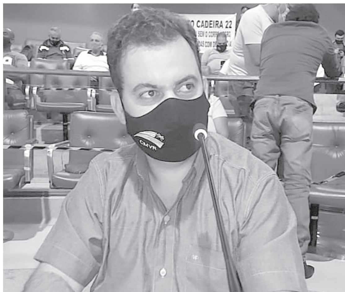
Vereador diz que município deve priorizar vacinação de moradores que comprovarem residência em Volta Redonda